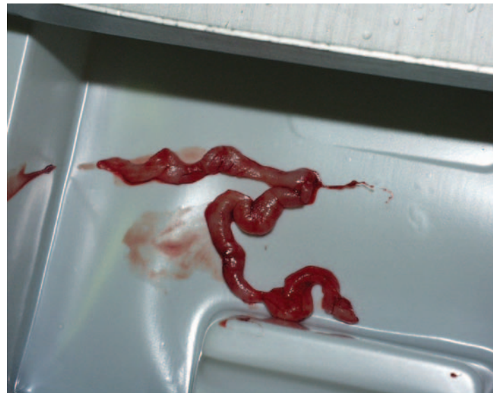
Figura 2. Diferentes sistemas empleados para la remoción del tejido

Puede ser empleada como medida paliativa en pacientes donde una cirugía convencional está contraindicada, siempre y cuando se asuman los resultados limitados de la misma.